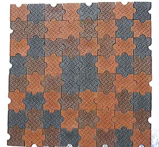
インターロッキング